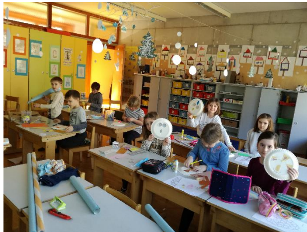
Utrinke za mesec februar sem zapisala Silva Vlašič.